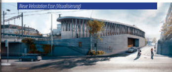
Neue Velostation Esse (Visualisierung)

Auch bezüglich Neugestaltung und Aufwertung von Strassenabschnitten tut sich einiges. So sind die Planungen der Wart-, Paul- und Gertrudstrasse bereits weit fortgeschritten. Das Gesamtbild der westlichen Bahnhofseite wird sich damit in den nächsten Jahren wesentlich verändern; es entstehen neue, qualitativ hochwertige Aufenthalts-, Begegnungs- und Bewegungsräume.